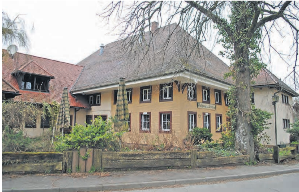
Seit November 2009 ist der „Löwen“ im Geroldstal im Dornröschenschlaf versunken. Doch die Prinzen kommen ...